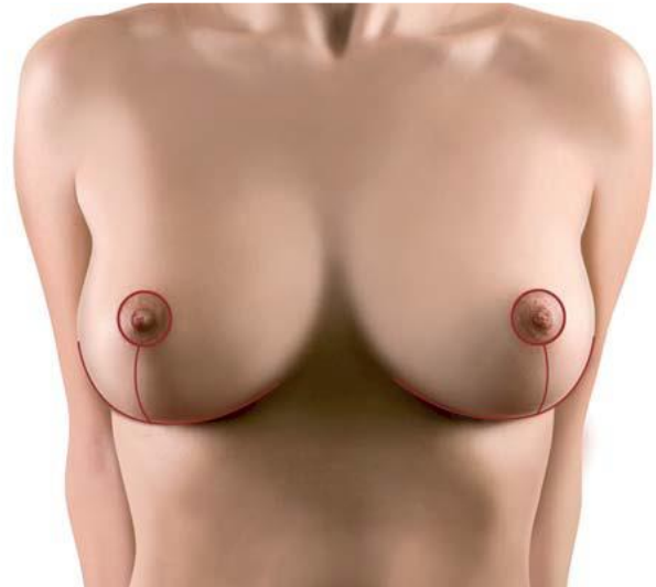
Mastopessi con cicatrice a "T rovesciata"

Secondo la prima è preferibile asportare unicamente la pelle attorno all'areola, risultandone solo una cicatrice circolare attorno a questa. In tal caso la forma della mammella può risultare un po' appiattita (tecnica del "round block"). La seconda linea di pensiero persegue, invece, la